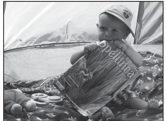
Voilà ce qui arrive aux périodiques qui ne respectent pas les règles de base de la publication spéléo...

En dehors de ces considérations basement matérielles, il a été dit des tas de choses sur ce que devait être ou ne pas être le bulletin... En résumé : il faudrait pleins d'articles scientifiques, de préférence avec beaucoup de schémas hauts en couleur (mais illisibles, puisque comme je viens de le lire, on n'a pas encore le budget couleur...) et plein de mots à 17 syllabes. Deuxième exigence : des récits d'explo (ne seront publiés que les trous dont le développement total est supérieur à 5km et/ou de profondeur supérieure à -800m). On essaiera de tenir dans la mesure du possible un équilibre de 50/50 entre les explos en Haute-Garonne et dans le reste du monde. Et bien sûr, nous nous engageons à publier dans leur intégralité tout texte de loi touchant de près ou de loin à notre activité (à ce propos, le prochain numéro sera un hors-série spécial EPI, env. 756 pages, éd. limitée, pensez à le commander dès maintenant) et tout changement dans les statuts de la Fédération Française de Spéléo. Ceci dit, ne vous affolez pas, si vous nous envoyez des articles qui s'éloignent un petit peu de notre ligne rédactionnelle, nous essaierons quand même de les caser dans un coin du bulletin