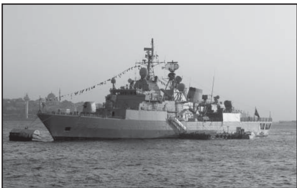
La motion proposée par le CRS de Midi-Pyrénées, proposant que 0,002% du budget de la défense nationale soit distribué aux clubs de spéléos, a été refusé lors de la dernière AG de la FFS...