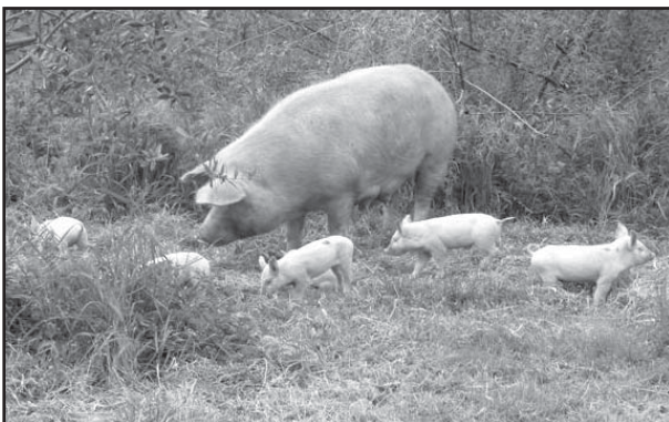
Le nouveau président du CDS31 et ses adjoints...