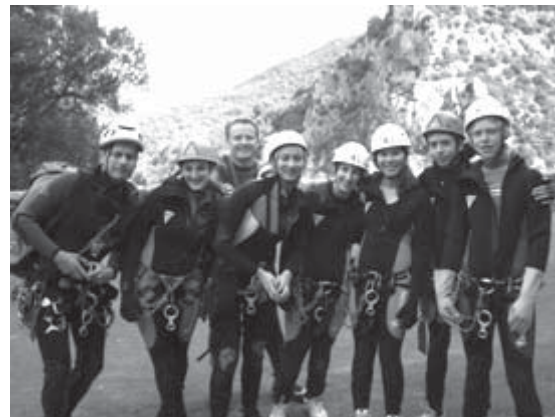
L'équipe au complet.

Sortis de la première réunion CDS de l'année 2008 et après avoir attentivement écouté les directives de jeunesse et sports, nous décidâmes d'organiser une sortie découverte canyon ayant pour cible un public majoritairement féminin et jeune. L'objet du projet était motivant à plus d'un titre. Aucun projet de la sorte n'avait déjà été réalisé par les membres de l'association. Ce serait donc une première. L'idée lancée, il nous fallut prendre notre bâton de Pèlerin et frapper aux portes des lycées. Nous utilisâmes notre réseau d'adhérent. Nos obtînmes notre premier rendez dans le courant du mois de février. Il s'agissait alors de présenter et de faire partager notre envie à l'équipe administrative du lycée Caousou. Avec une agréable surprise,