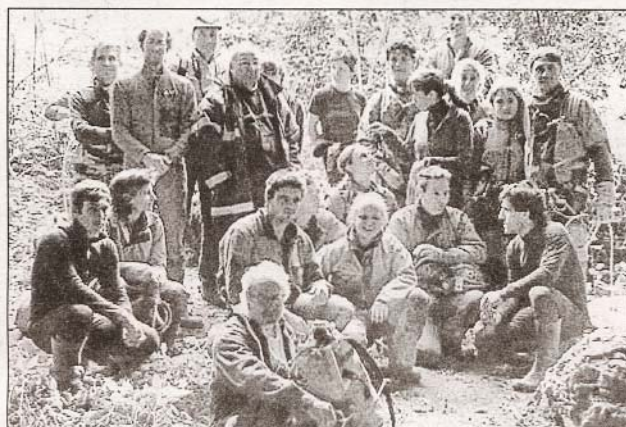
■ Fin de l'exercice dans l'Espugue