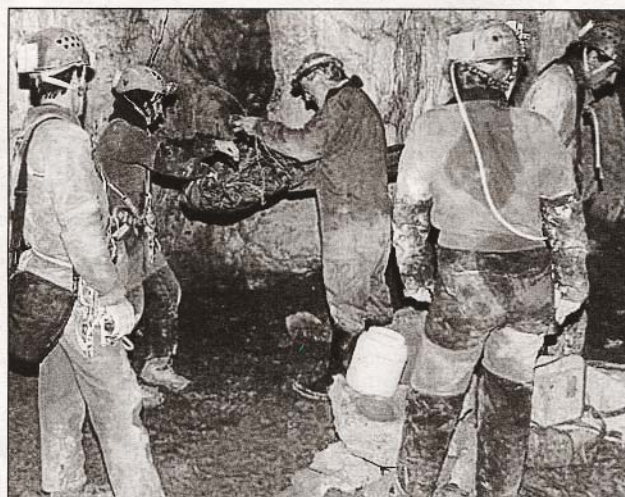
■ On remballage le matériel de secours

Le 18 et 19 octobre, le chalet Ldes spéléologues était en effervescence. Vingt spéléologues de la Société de Secours Spéléologique étaient sur le terrain pour une remise