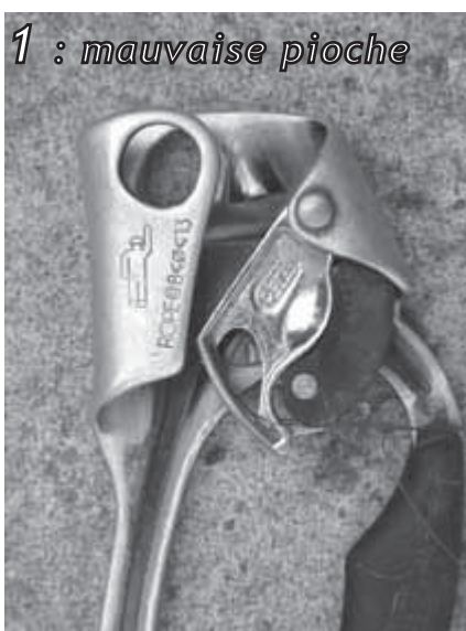
Les frais de port pour toute poignée renvoyée à PEZL seront pris en charge par la SSS31. Contactez Buldo.

Conseiller Technique National de spéléologie Fédération Française de spéléologie